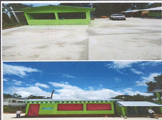
Foto 4: Concluyen con el techo nuevo, mejoramiento del piso del aula y pintura para todo el establecimiento.

Observación: Si es necesario se pueden agregar hojas adicionales y actualizar el número de hojas.