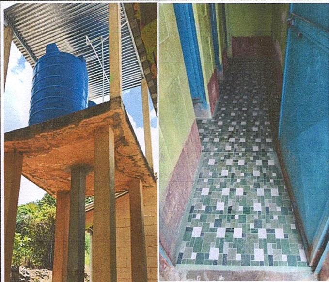
Foto 2: Se finaliza con la instalación de los Depósitos de agua, instalación de tubería para agua potable y colocación de piso en los servicios sanitarios.