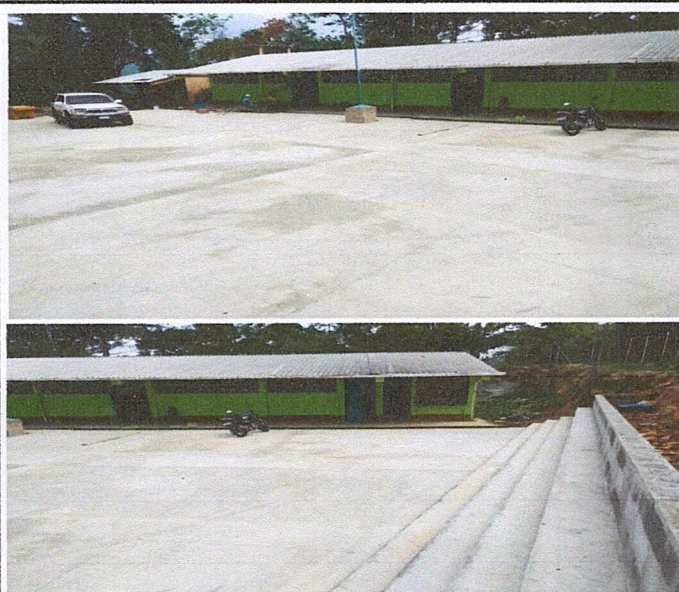
Foto 1: Se concluye con el mejoramiento de la loza del piso del patio del establecimiento en su totalidad, así mismo pintura del establecimiento.